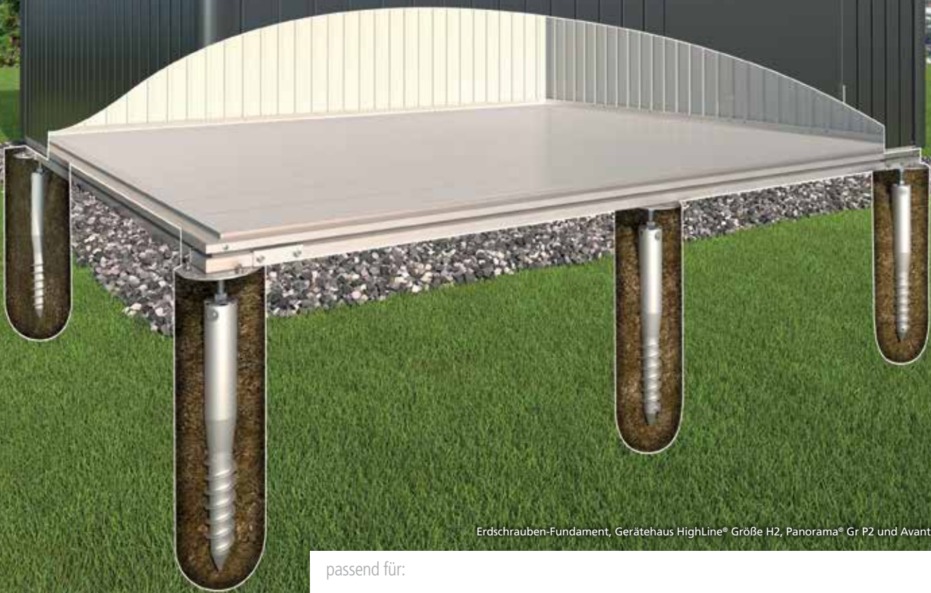
Erdschrauben-Fundament, Gerätehaus HighLine® Größe H2, Panorama® Gr P2 und AvantGarde® Gr. L